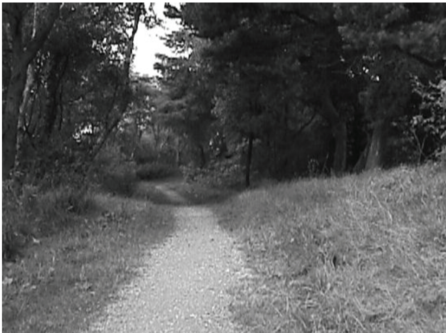
Krebsestien 1998 nord for vandværket.

Tilflytningen til Esbjerg by var jo ekstra voldsom. Fra 1868 til 1901 voksede indbyggertallet fra ca. 30 til over 13.000. Esbjerg blev selvstændig kommune i 1894 og fik købstadsstatus i 1899.