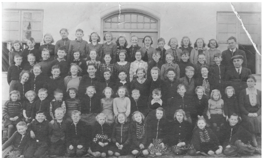
De mindste klasser fra Gjesing Skole ca. 1942

Tyskerne opførte sig godt og gav os for eksempel mad til grisene fra deres køkken. De kom med maden i tønder. Mange af dem havde selv børn derhjemme, og når de kom fra orlov, havde de som regel no-