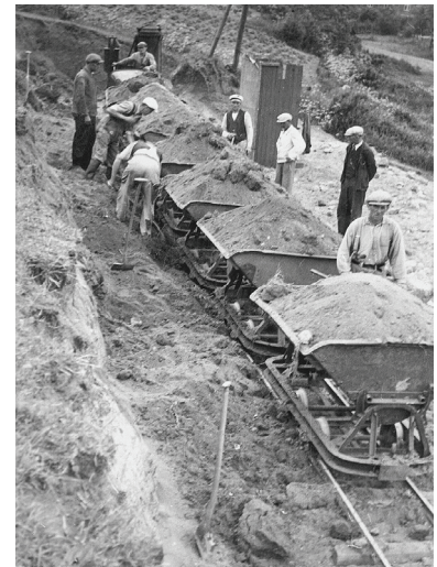
Hovedvej 12 (Stormgade) Anlægges

I dag kan jeg ikke lade være med at tænke på, hvor megen tid, der gik med al denne udenadslæren i religion og danmarkshistorie. Den tid, der her blev brugt, kunne med stor fordel have været anvendt på fysik eller udenlandske sprog.