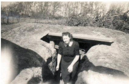
Nedgang til vores beskyttelsesrum i haven

Vi havde også en ged, som jeg for øvrigt havde lavet et seletøj til, så den kunne bruges som trækdyr for en lille vogn. Den