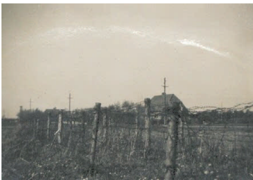
Mit hjem "beskyttet" af minefelter Og pigtrådsspærringer

Jeg husker meget tydeligt, at min far ikke ville mørklægge. Han ville ikke lade sig kommandere af nogle tilfældige tyske soldater, der havde besat landet. Da vi imidlertid var blevet truet med skud mod ikke mørklagte huse, bøjede han sig for min mors ønske om at få vinduerne dækket til. Det skete ved at hænge tæpper o.l. for vinduerne. Nogle dage efter kunne man købe sorte rullegardiner, som vi kunne bruge. Vi vænnede os hurtigt til, at vi ikke måtte bruge lys, der kunne ses fra luften. Såvel billygter som cykellygter blev også "mørklagt". De blev forsynet med en slags hætter, hvorfra der kun kunne trænge en smal lysstribe ud. Al gadelys blev slukket, så alt lå hen i mørke.