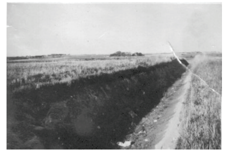
En tankspærring 3 m. dyb, 5 m. bred

Det sted, jeg tjente i 1940/41, lå lige op til det område, der var afspærret, så jeg kunne fra gårdens marker følge med i hvad der skete i det afspærrede område. Foruden at der var en vældig aktivitet med byggeri osv, kunne jeg følge, hvordan der blev ekserceret og kommanderet med soldaterne, der blev holdt i skarp træning. Jeg kom for øvrigt nogle gange inden for det afspærrede område. Det var, da jeg var ansat ved