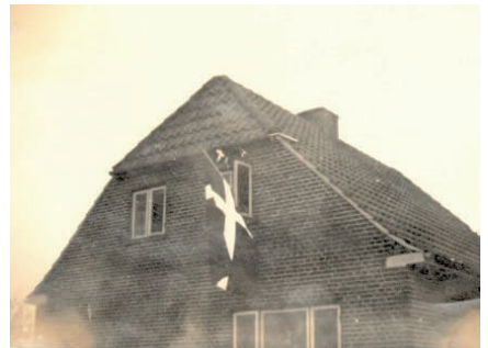
5. Maj 1945

Der skulle for øvrigt gå mange år efter krigen, før tingene fungerede normalt igen. Jeg tror,