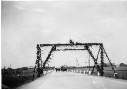
Æresport rejst på Stormgade (Ved nuværende afkørsel til Bilka) Til ære for engelske soldater. Den blev dog væltet af tyske Soldater, inden englænderne nåede frem

Min kammerat havde siddet og hørt radioudsendelsen om tyskernes kapitulation. Og han blev lige som vi andre ellevild og løb straks ud på vejen og i kådhed sparkede han noget jord ned i