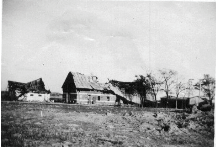
Således så én af gårdene i Gjesing ud efter luftangrebet på Esbjerg Flyveplads I august 1944

Alle lokaler skulle bruges til indkvartering af soldater.