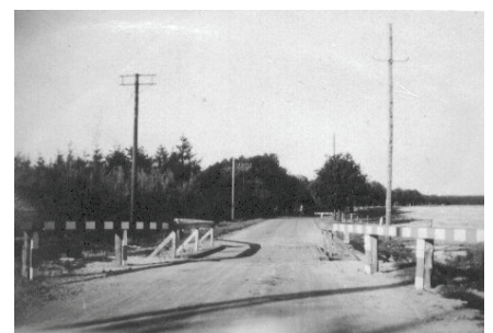
"Bro" over tankspærring I Spangsbjerg