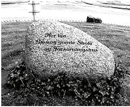
Stenen midt i rundkørselen ved Gjesing Centret.

Den sidste bygning, der har hørt under Spangsbjerg Mølle, blev revet ned for et par år siden. Den lå på hjørnet af Spangsbjerg Møllevej og Hospitalsvej. Selve møllen brændte i øvrigt flere gange.