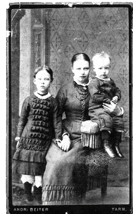
Gjesings historie 1-24