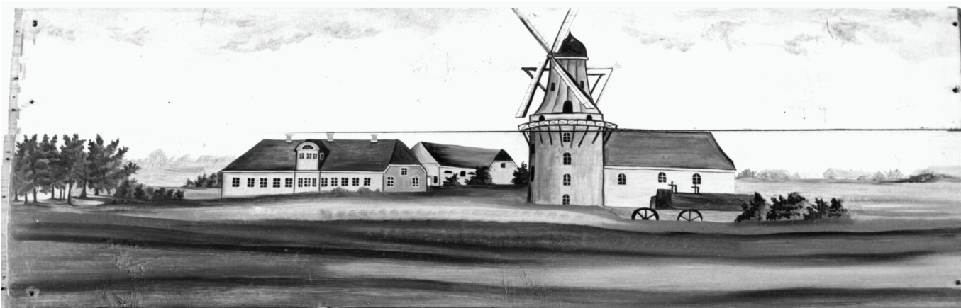
Ovenstående billede af Spangsbjerg Mølle sad som dørstykke i en gård i Rousthøje. Dørstykket er malet mellem 1857 og 1871.