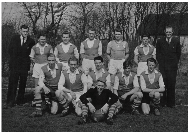
Idrætsforeningens første 1. hold 1950.