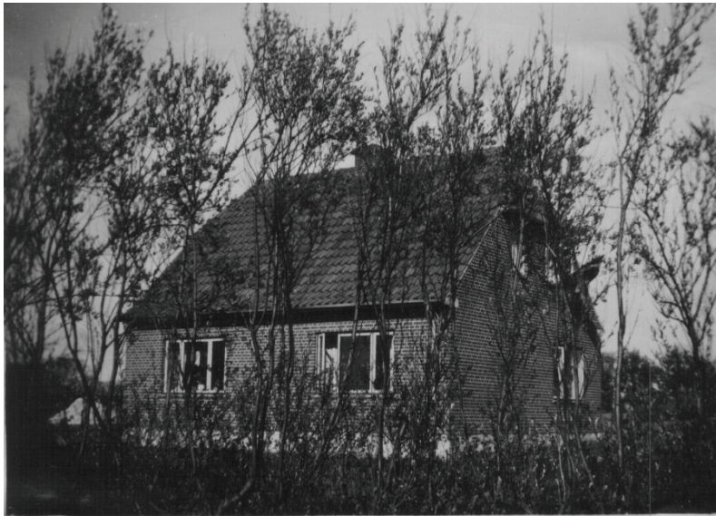
Mit barndomshjem – ligger endnu over for sø på Søndervangsvej