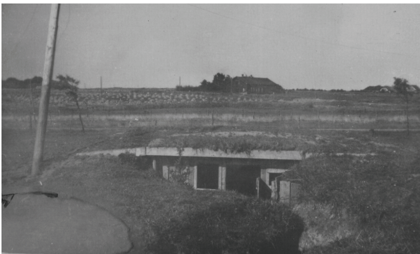
Tysk ringstilling udenfor mit hjem