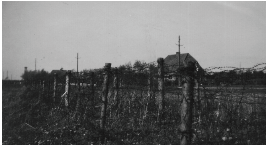
Mit hjem "beskyttet" af tyske minefelter og pigtrådsspærringer

I Ungdomsforeningen fik vi kulturelt stof fyldt på med højskolesangbogen, foredrag og kaffe bag efter. Dette foregik i Forsamlingshuset, og alle deltog. Der kunne være 40-50 unge sådan en aften, hvor fællesskabet var i højsædet. Ellers var det Gjesing Foredragsforening, der bar byens kulturliv.