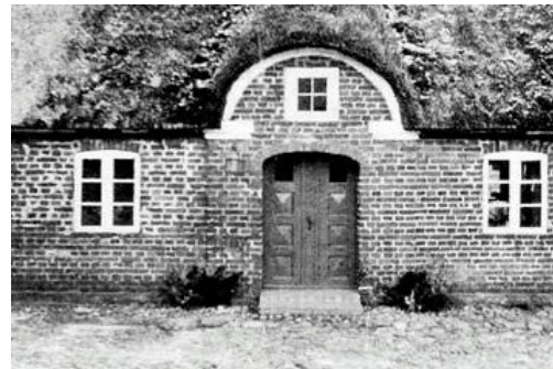
Hoveddør fra slægtsgården i Hessel.

De tre fag til højre har oprindeligt været sammenbygget med en del af stalden, medens den vestlige del, med de større ruder, nok er opført 1876. Under de gamle gulve er der fundet rester af hugorme i lerkrukker, -vel nok nedsat som værn mod sygdom og ulykke.