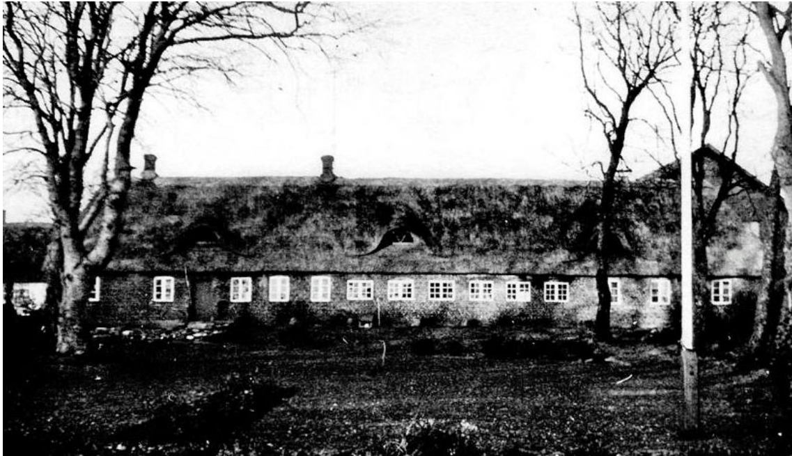
Slægtsgården i Hessel, opført ca. 1794.

De tre fag til højre har oprindeligt været sammenbygget med en del af stalden, medens den vestlige del, med de større ruder, nok er opført 1876. Under de gamle gulve er der fundet rester af hugorme i lerkrukker, -vel nok nedsat som værn mod sygdom og ulykke.