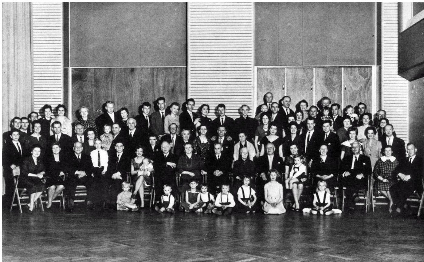
Fra slægtsfesten på Esbjerg Højskolehjem 1960