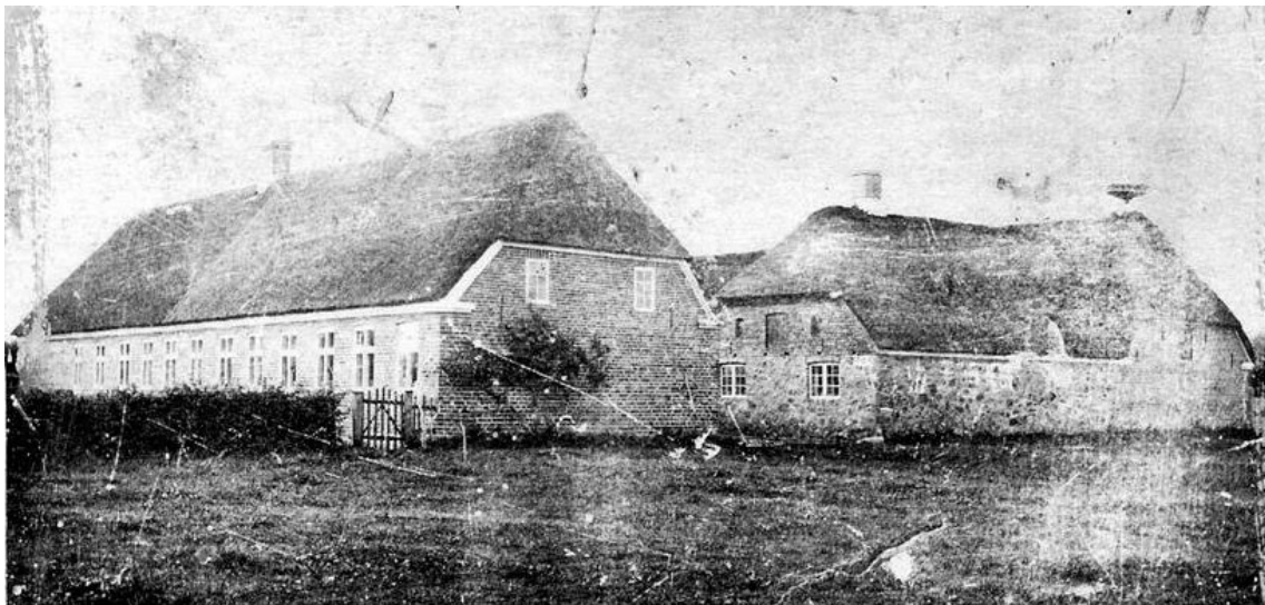
Slægtsgården i Roust. Opført ca. 1828- nedrevet 1925.